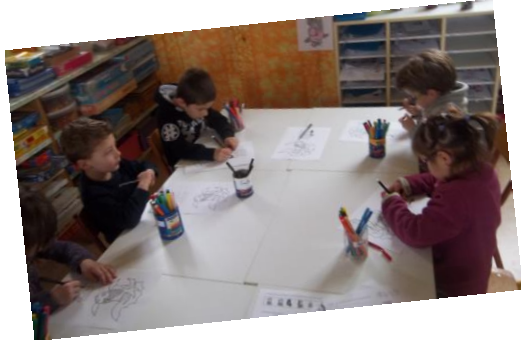
Porte bonheur chinois

Puis nous avons eu le choix entre 3 ateliers :