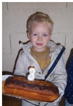
3 ans le 26/09