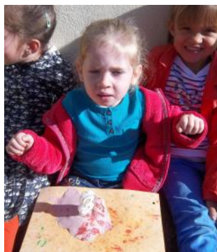
3 ans le 15/09