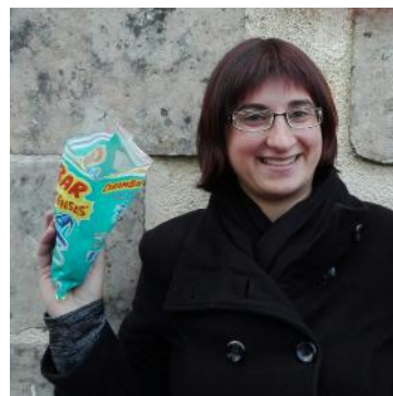
ans le 24/09... oups !