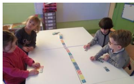
Les jeux de numération