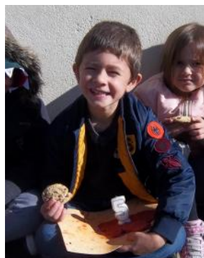
5 ans le 18/09